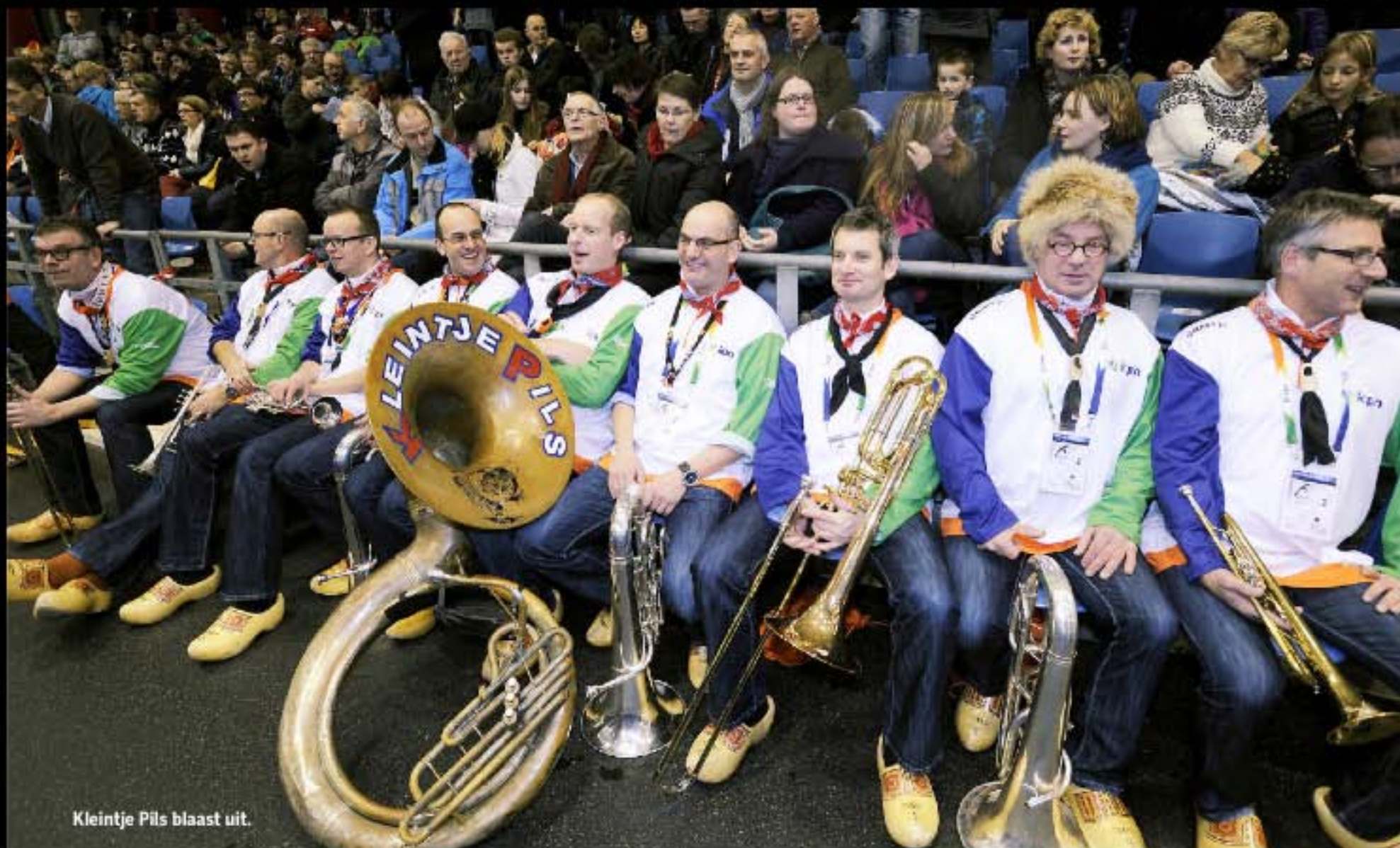
Kleintje Pils blaast uit.